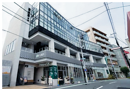
当社も入居する開発支援を行った商業ビル

た自然に囲まれた地域であり、江戸時代には、多摩川と旧津久井街道の終節点にある宿場町としてにぎわいました。その後もJR南武線や小田急線の交通結節点として発展してきましたが、急速な市街化に公共施設の整備が追いつかず、生活環境の悪化等が指摘されるようになったことから、その解決策として開始されたのが、現在の登戸土地区画整理事業です。土地区画整理事業では街全体を更地にし、一から道路や建物をつくり直します。対象エリアは、登戸駅から向ヶ丘遊園駅北側の約37.2ha(東京ドーム約8個分)と広大でしたが、いよいよ登戸駅周辺と向ヶ丘遊園駅周辺を残すのみとなっています。