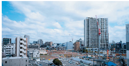
土地区画整理中の登戸地区

川崎北部有数の新たな商業圏が形成されつつある登戸・向ヶ丘遊園で当社は、土地区画整理事業エリア初の飲食集積ビルをはじめ、十数棟の商業ビル等の開発支援、テナント誘致を行ってきました。2021年には、人と街のリアルな接点づくりや情報発信の拠点づくりを目指し、レンタル会議室を併設したNOBORITO